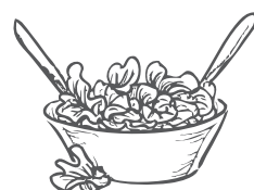
Tomatensalat insalata di pomodori