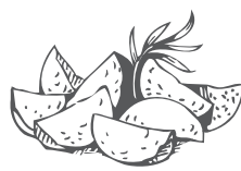
Rosmarinkartoffel patate al rosmarino