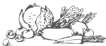
Ofengemüse verdure al forno